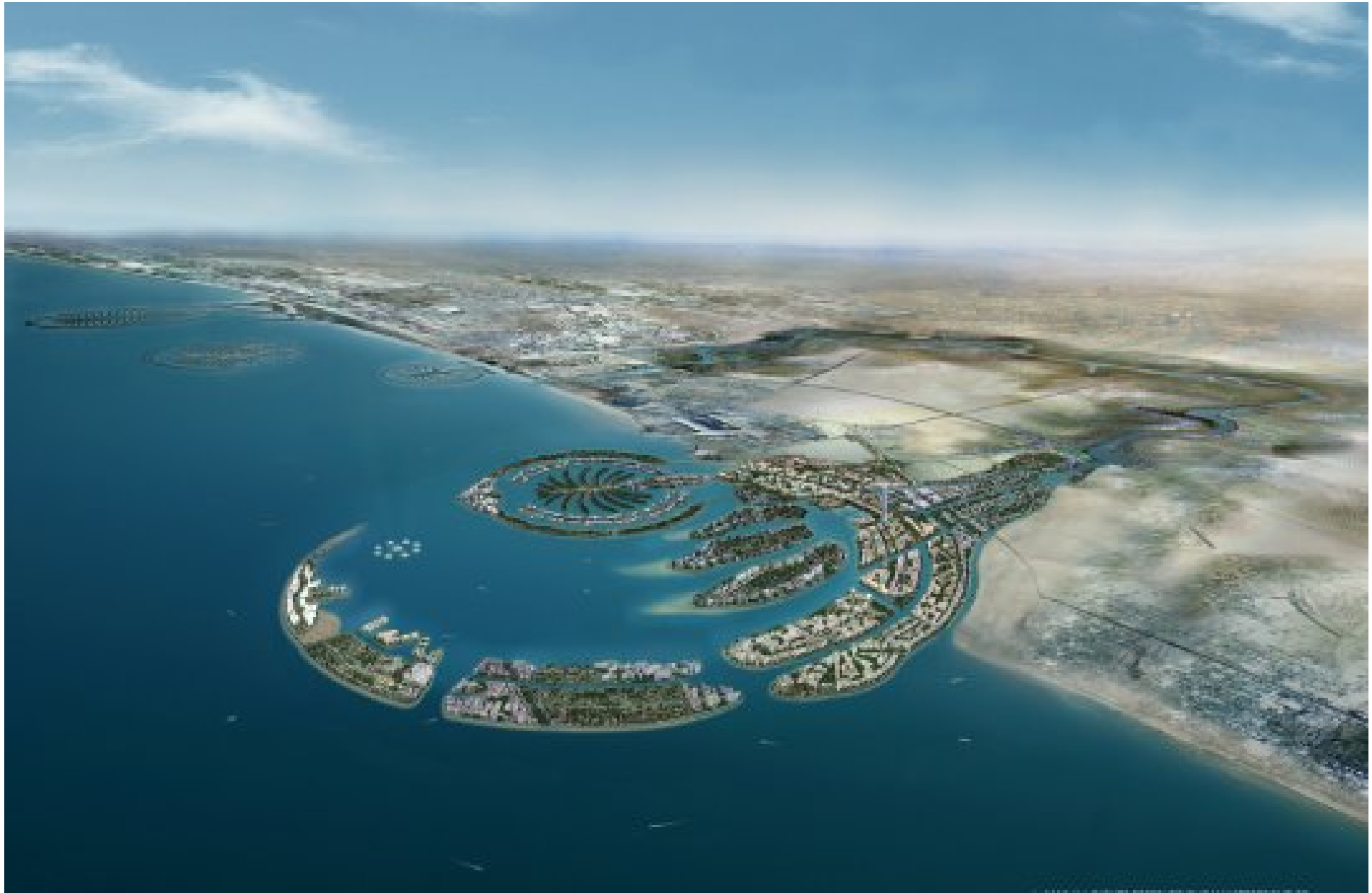
Dubai Waterfront. Avançant sur les eaux du Golfe, cet ensemble d'îles en forme de croissant s'étendra sur 81 kilomètres carrés. Devenant le plus grand front de mer au monde, il détrône ainsi l'île de Manhattan à New York.