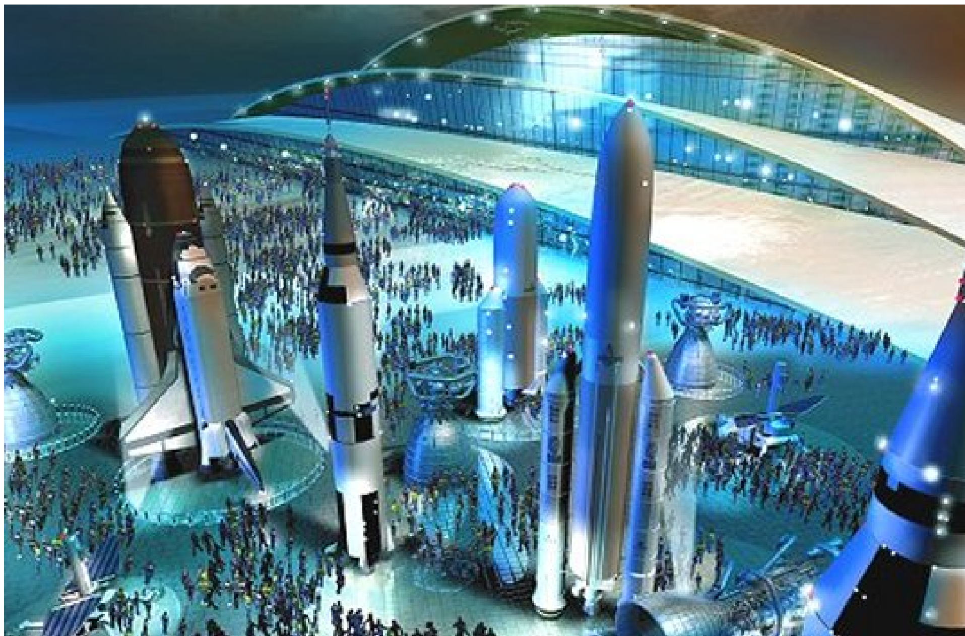
Space Science World. L'espace est l'un des sujets exploités dans l'immense parc à thèmes de Dubailand qui a l'ambition de devenir le plus grand parc touristique et d'attractions au monde.