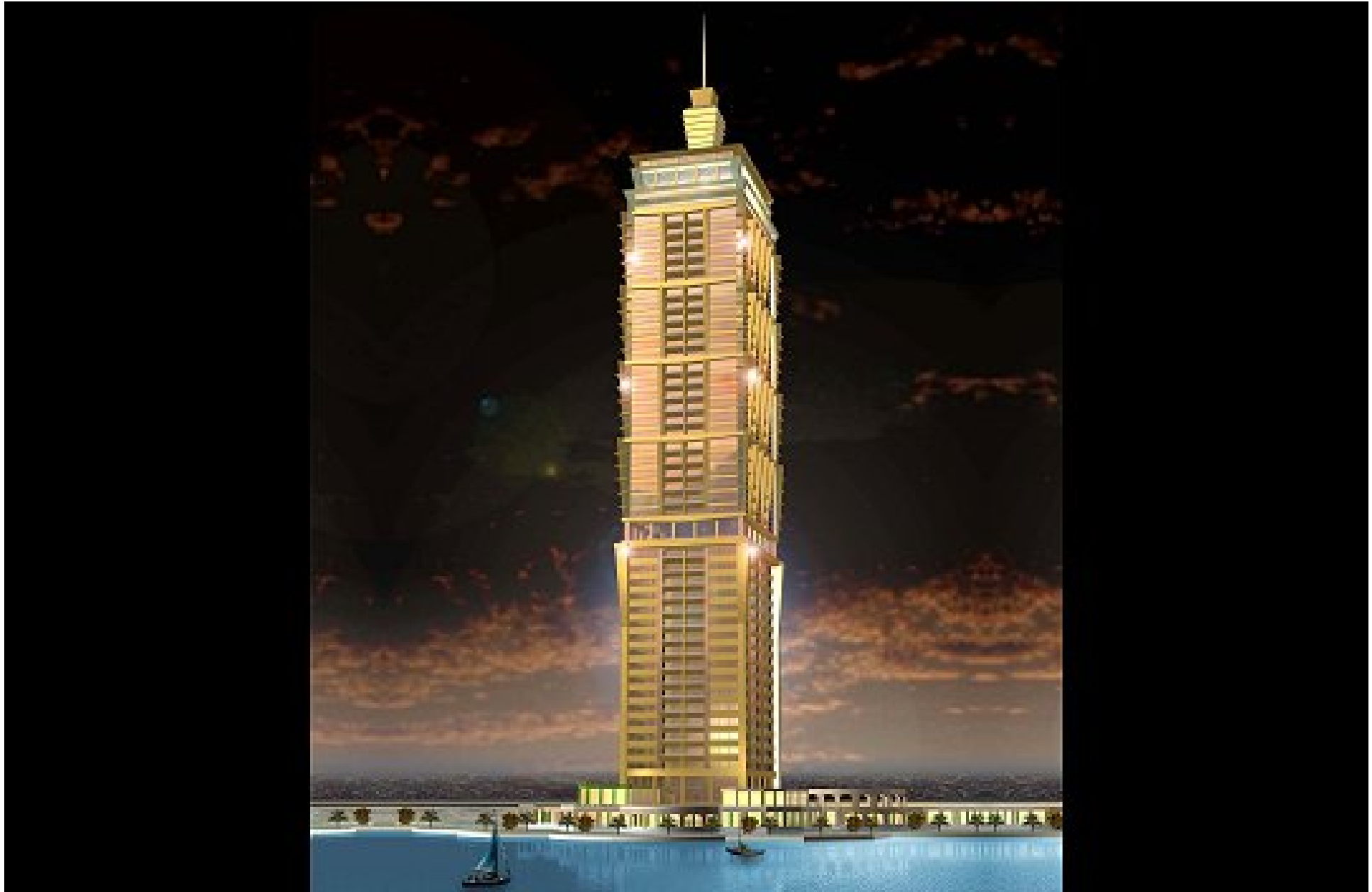
Nakheel Falcon Tower. Cette tour s'inscrit dans la construction de l'ambitieuse propriété ultra-moderne baptisée Jumeirah Lake Towers. Cette dernière est elle-même incluse dans le gigantesque Dubaï Waterfront.