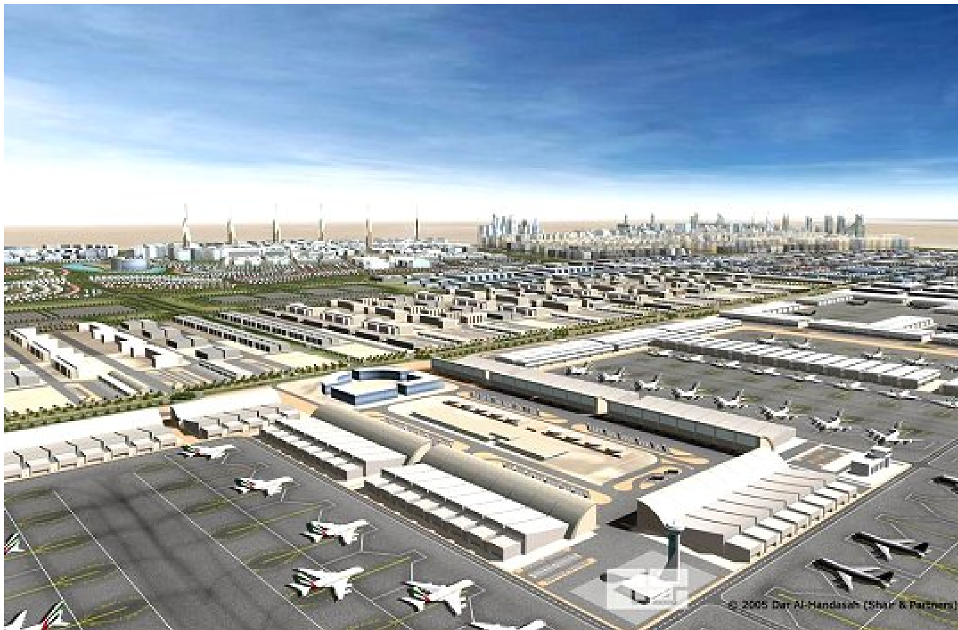
Dubai International Airport. L'aéroport international de Dubaï, le plus actif au monde, accueille annuellement 22 millions de voyageurs par an. Après son agrandissement (en 2008) dont la seconde phase a été entamée, 70 millions de passagers y transiteront chaque année.